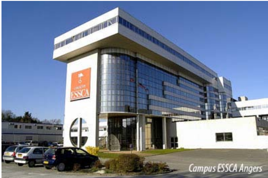
Campus ESSCA Angers