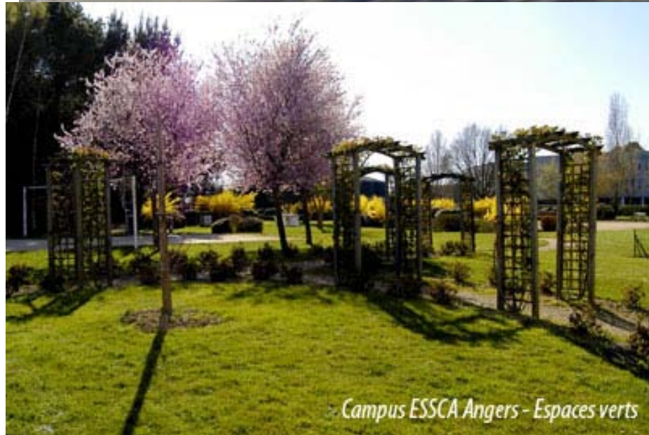
Campus ESSCA Angers - Espaces verts